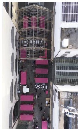
Container 02 ed.2025